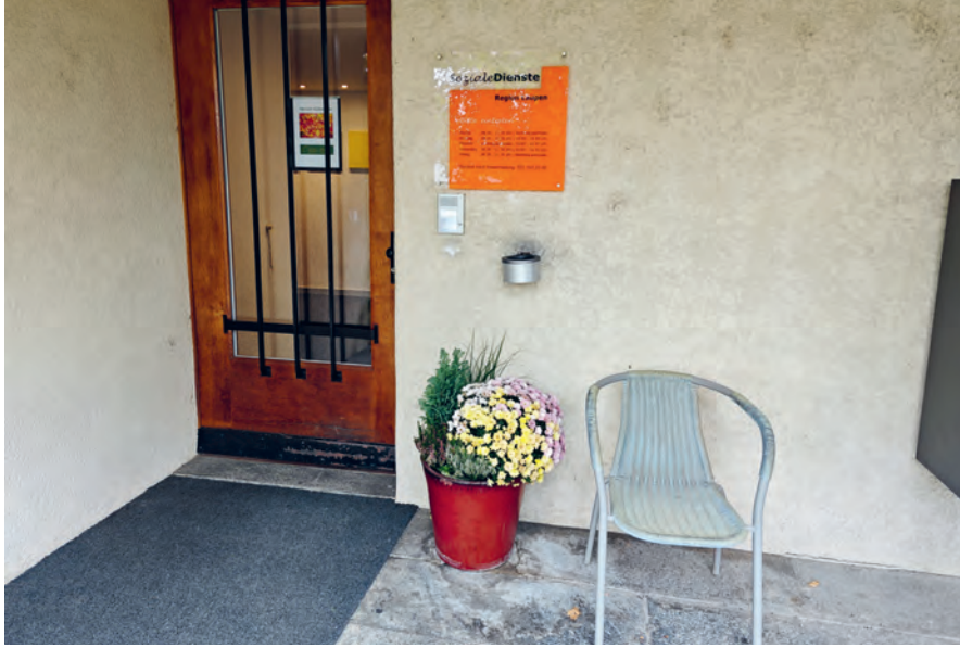
Oben: Der Eingang mit Liebe zum Detail.